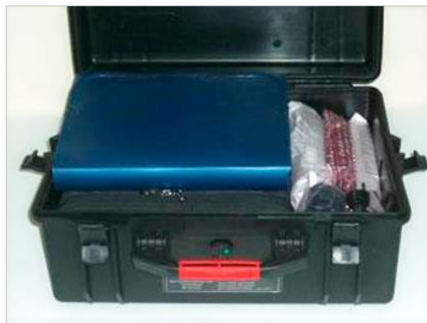
Тара для транспортировки — герметичный ударопрочный кейс