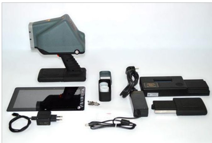
Комплект ПРФА «МетЭксперт»