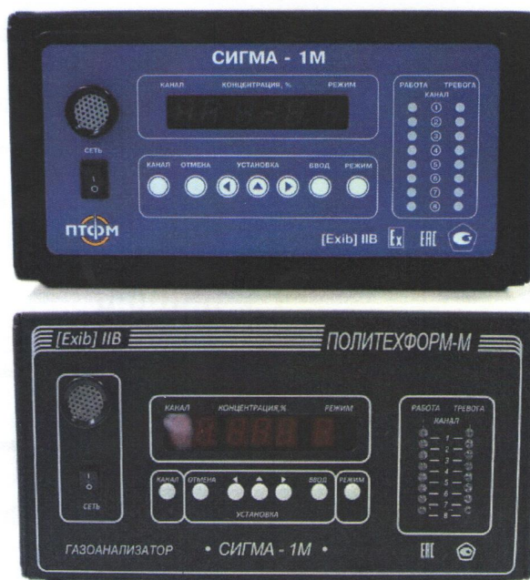
Рисунок 1 – Общий вид газоанализатора с двумя вариантами исполнения лицевой панели